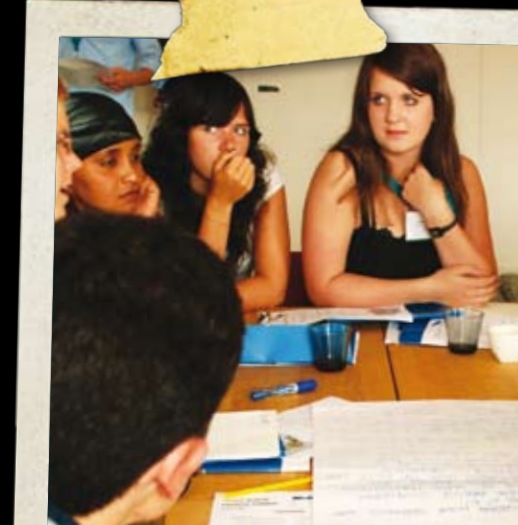
Global Competition and Climate Changes Umsækjandi: Norræna félagið í Norrbotten, Svíþjóð

Kuldiga Culture Centre safnaði saman áhugasömum ungmennum frá Svíþjóð, Danmörku, Íslandi, Eistlandi, Lettlandi, Litháen og Rússlandi á námskeið, þar sem þátttakendur fengu möguleika á að leggja sitt af mörkum til að auka skilning á sameiginlegri norrænni menningu. Þar var líka unnið að því að vekja áhuga hjá fleiri ungmennum fyrir list, menningu og sam-norrænu arfleifðinni. Allt þetta fór fram í Kuldiga í Lettlandi dagana 30. nóvember til 2. desember 2007.