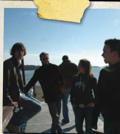
Young Foreigners in Aging Europe Umsækjandi: Helsinki Centre Youth, Finnlandi

Helsinki Centre Youth hélt í apríl 2008 málstofu þar sem rætt var sérstaklega um þær lýðfræðilegu áskoranir sem Evrópa og Norðurlöndin eru að horfast í augu við. Mun þessi lýðfræðilega stefna hafa í för með sér betri kjör fyrir útlenda minnihlutahópa? Hvernig eiga útlendingar að haga sér gagnvart vinnuþingum og tungumáli nýja heimalandsins? Á málstofunni ræddu þátttakendur meðal annars mismunandi fræðileg efni varðandi vinnuþingum. Þátttakendurnir voru frá Danmörku, Eistlandi, Finnlandi, Íslandi, Norðvestur-Rússlandi og Svíþjóð.