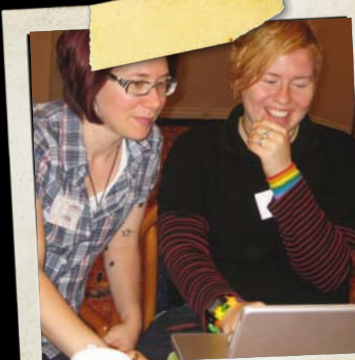
Students for Transgender Inclusion Umsækjandi: ANSO, Association of Nordic LGBTQ Student Organization, Danmörku

Dagana 8.-10. ágúst 2008 hélt Norræna félagið í Norrbotten ráðstefnu í Haparanda í Svíþjóð þar sem þemað var alþjóðleg samkeppni og loftslagsbreytingar. Þátttakendur ráðstefnunnar ræddu áhrif hnattvæðingarinnar á norðurheimskautsvæðið og hvernig norræn svæðissamvinna getur skapað forsendur fyrir Norðurlöndin sem samkeppnishæft og umhverfislega réttlæt-anlegt svæði.