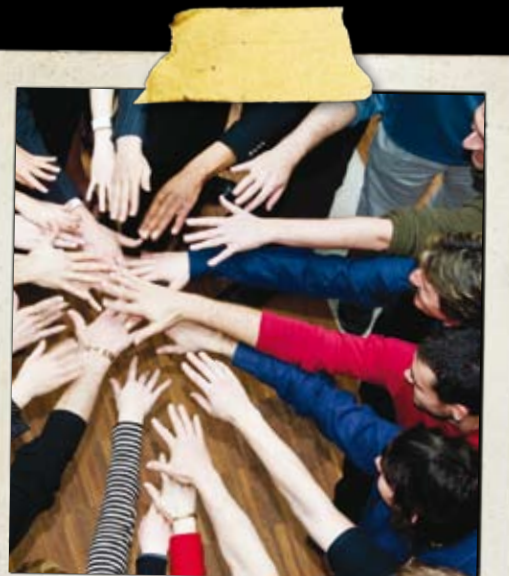
Styrkur til samtaka og netverkefna

Verkefnið hefur skýran norrænan tilgang og skiptir máli fyrir börn og ungmenni á Norðurlöndunum.